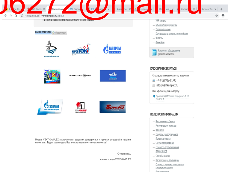
Рисунок 4 - Клиенты ООО ПК «ВентКомплекс»

Клиенты ООО ПК «ВентКомплекс» приведены на рисунке 4.