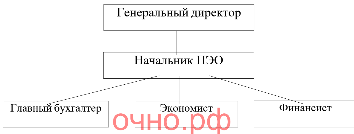
Рисунок 3 - Структура планово-экономического отдела ООО «ПК ВентКомплекс»

Структура планово-экономического отдела ООО «ПК ВентКомплекс» представлена на рисунке 3.