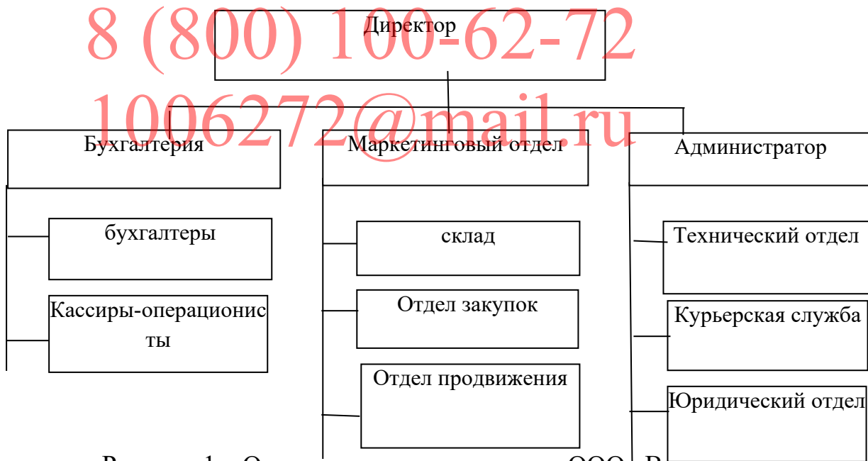
Рисунок 1 – Организационная структура ООО «Виктория»

Возглавляет ООО «Виктория» директор предприятия (рисунок 1).